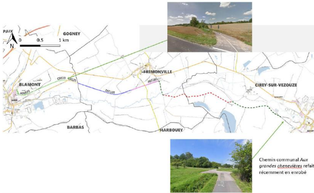
Chemin communal Aux grandes chenevières refait récemment en enrobé